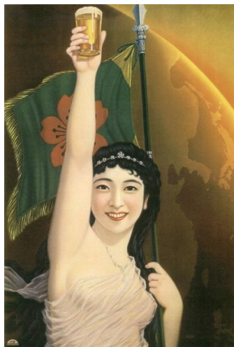
Пиво «Sakura», 1928-1932

Свойственное для традиционного японского общества осмысление женщины, как существа, угождающего мужчине и заботящегося о нём, в полной мере проявилось и сейчас – именно женщина подносила бокал пива, предлагала выпить сакэ и послушать радио, лечила, приглашала в путешествие. Некоторые модели были одеты в европейское платье, но многие щеголяли и в кимоно. Но и кимоно не могло «спасти» «чисто» японскую красоту. На самом деле на рекламных плакатах того времени были представлены японские женщины, мало похожие на «настоящих» японок. Многие модели были стрижены по-европейски, некоторые делали завивку. Их миндалевидные глаза потеряли характерный для монголоидов разрез и черный цвет. Кожа была не тёмной, а белой, губы – ярко-красными, на щеках «играл» румянец, нанесенный с помощью косметики. Эти губы растягивались в широкой «голливудской» улыбке, совершенно не свойственной для образа традиционной японки. Улыбка обнажала зубы, что прежде считалось совершенно неприличным (обнаженные зубы – признак злодейства и агрессивности). Пальцы украшали кольца, отсутствовавшие в списке традиционных женских аксессуаров. Можно было увидеть и красавицу с розами, которые раньше выступали в качестве растения, характерного для «коварного» Запада, доказательством чего служили спрятавшиеся за ярким цветком шипы [7].