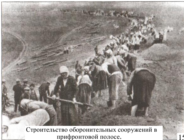
Строительство оборонительных сооружений в прифронтной полосе.

Но летом 1942 года ситуация на фронте резко осложнилась. Новое наступление немцев превратило край в прифронтный регион. Немецкое командование планировало захватить Северный Кавказ, а затем, овладев Закавказьем, прорваться на Кавказ. Местное командование оказалось не готово к смене обстановки. Отсутствовали или были не полностью готовы инже-