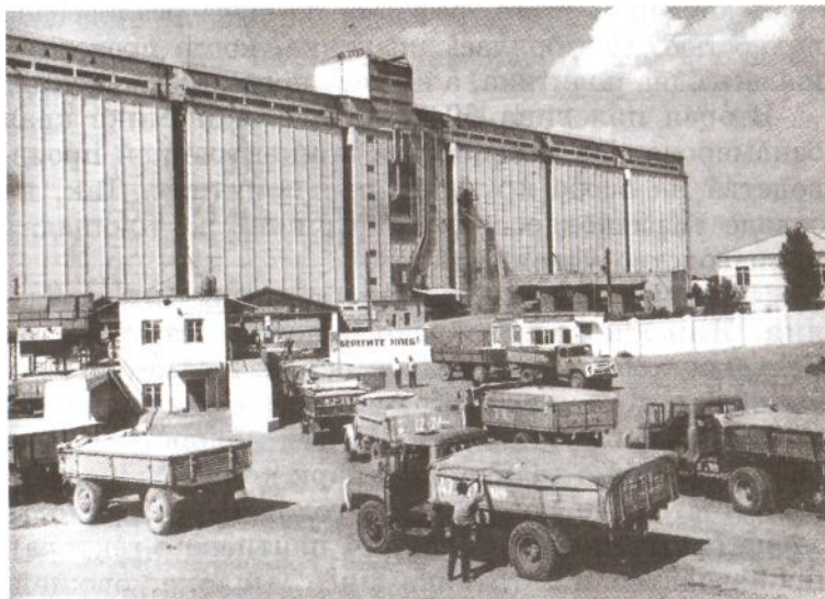
Элеватор. г. Кропоткин.