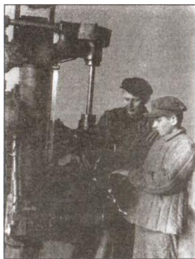
У станка сыновья заменили отцов, 1941 год, г. Ейск.

поэтому в условиях нехватки кадров из-за массовых мобилизаций на фронт на производство пришли женщины и дети, вернулись пенсионеры. От них требовалось работать не только за себя, но и за ушедших на фронт. Жители Кубани, оказывая помощь фронту, проявили подлинный патриотизм и массовый героизм, ломая привычные представления о возможностях человека.