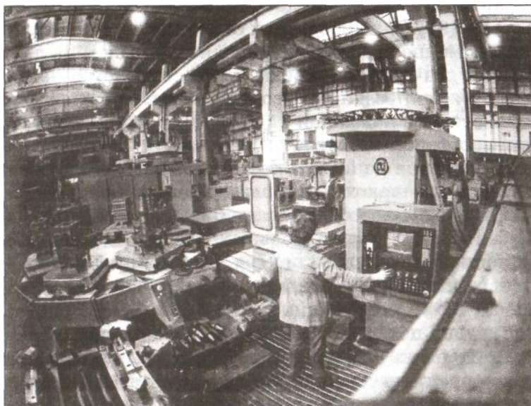
Участок автоматизированных обрабатывающих центров с ЧПУ, станкостроительный завод им. Седина.

Что касается приватизации в экономике, то она тяжело отразилась на состоянии крупных промышленных предприятий. Приведем два типичных примера. По состоянию на начало сентября 1997 г. по существу исчез завод «Октябрь», считавшийся головным по производству деталей моторов тракторов пяти марок. По словам ветеранов завода, предприятие давно закрыто. Его продолжают растаскивать. В начале перестройки литейный цех завода