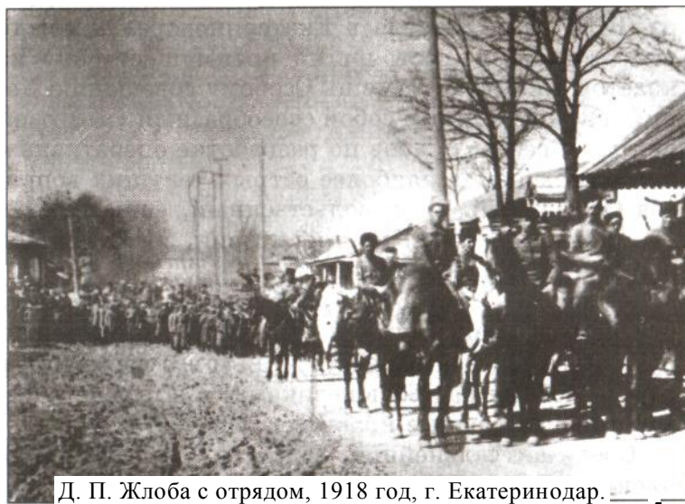
Д. П. Жлоба с отрядом, 1918 год, г. Екатеринодар.

В боевом отношении некоторые части и соединения Добровольческой армии обладали высокими качествами, так как в ее составе было много офицеров-профессионалов. Однако лучшие офи-