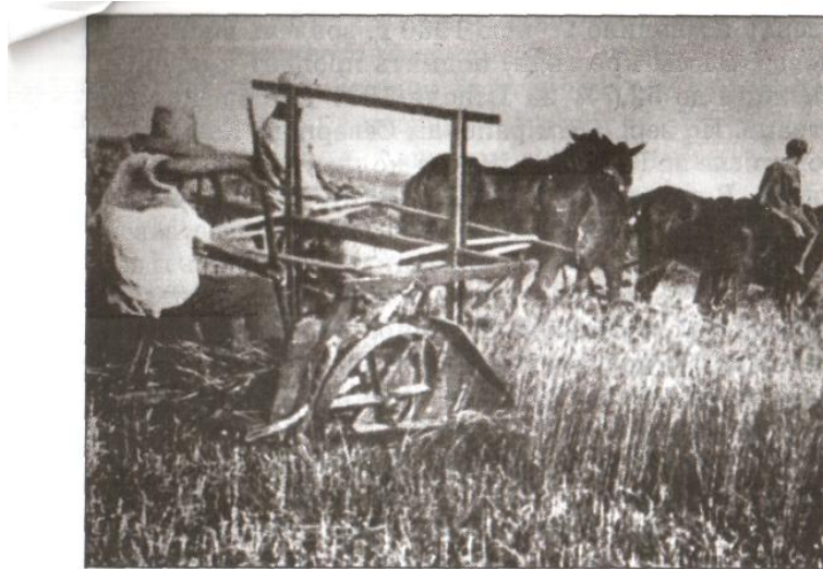
Уборка хлеба лобогрейкой-хлебокосилкой. 1930-е годы.

блемы существовали рядом и переплетались между собой. На Северном Кавказе было создано 5300 колхозов, причем много колхозов-гигантов — громоздких и трудно управляемых, отрицательный опыт которых разочаровывал крестьян (падеж скота, бесхозяйственность, безобразное отношение к тягловой силе, обезличка в ее использовании, уравниловка в оплате труда и т. д.). Для такого количества колхозов, производственных участков и бригад не хватало ни руководителей, ни машин, ни тракторов, ни опыта коллективного хозяйствования.