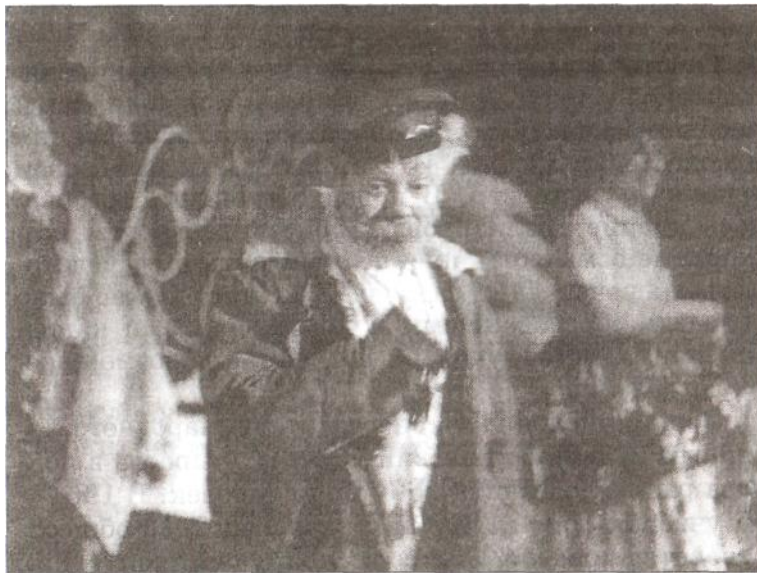
В. Круглов, народный артист РСФСР, в роли деда Сливы, спектакль «Любовь не виновата», г. Краснодар, театр оперетты.

В 1965 г. создан экспериментальный малый телецентр. Если в 1956 г. в крае было 123 телевизора, то в 1959 г. — 12,8 тысячи.