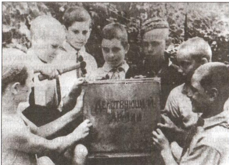
Отправка посылки на фронт, г. Сочи.

собствовавшая усилению связей тыла и фронта. Для населения Кубани организовывались передвижные выставки картин, в основном патриотической направленности. Осенью 1941 г. в Краснодарском художественном музее прошли выставки работ кубанских художников, а в октябре экспонировались картины И. К. Айвазовского, эвакуированные из музея в Феодосии. Аналогичную работу проводили театры Краснодара и Майкопа, на сценах которых с большим успехом шли пьесы патриотического содержания.