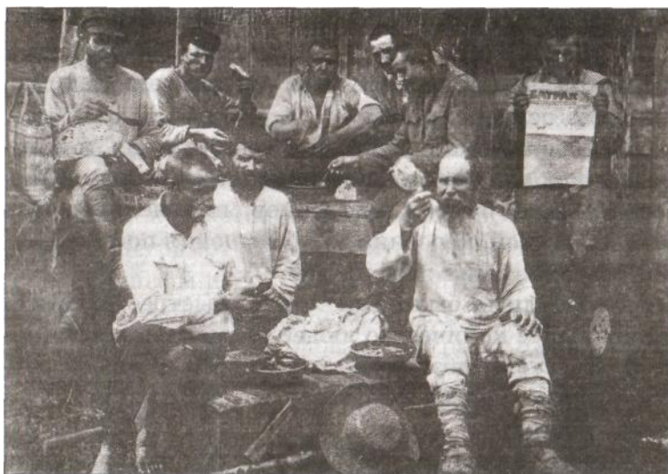
Члены крестьянского кооператива за чтением газеты «Батрак».

На Кубани такая комиссия была создана несколько позже, в январе 1921 г. В функции этой комиссии входило руководство всем делом организации обучения неграмотного населения. В городах и селах создавались школы грамоты, кружки, группы по ликвидации безграмотности (ликбезы). Учились все — старые и молодые, рабочие и крестьяне, мужчины и женщины. Учились красноармейцы, поло-