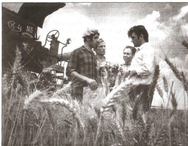
Комсомольско-молодежное звено колхоза им. Кирова Динского района, жатва.

лись меры по перераспределению национального дохода в пользу сельского хозяйства. Больше внимания уделялось социальным проблемам села. Была признана необходимость перехода от административных к экономическим методам управления сельским хозяйством и внедрения хозрасчета. Преодолевались идеи «отмирания» личного подсобного хозяйства крестьян.